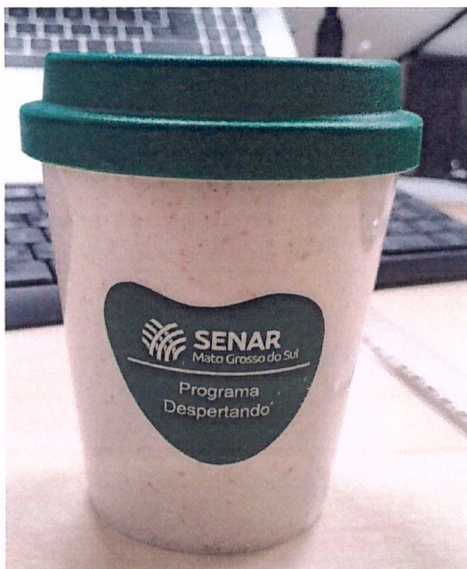
Registro Fotográfico – 1