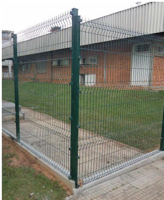
Figura 1 - Mudança de direção em 90°

Nos locais onde houver mudança de direção, caso a angulação seja de 90°, deverão ser utilizados dois postes, conforme figura 01. Nos locais onde a mudança de direção for em ângulo diferente de 90°, se possível, poderá ser utilizado apenas um poste, conforme figuras 02 e 03.