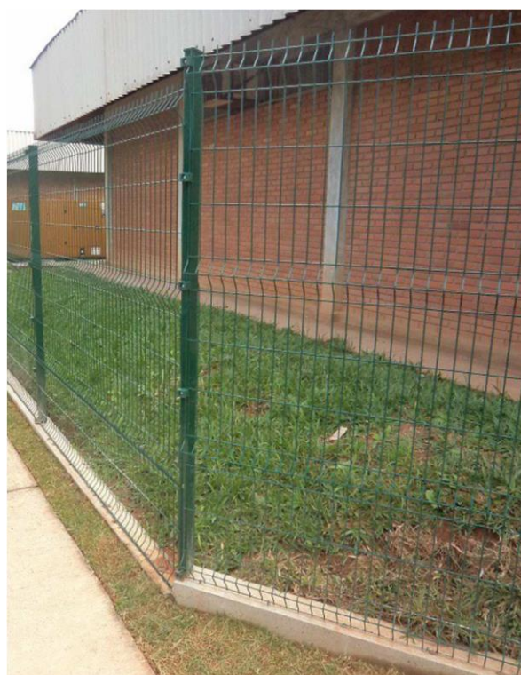
Figura 2 - Mudança de direção diferente de 90°