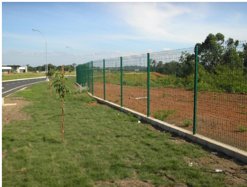
Figura 1 – Exemplo do padrão desejado

diâmetro mínimo de 5,0mm, estruturados em postes metálicos, pintados em tinta de alta resistência a intempéries na cor verde. O gradil deverá ser fixado em uma viga baldrame (15X20 cm) conforme detalhes de projeto.