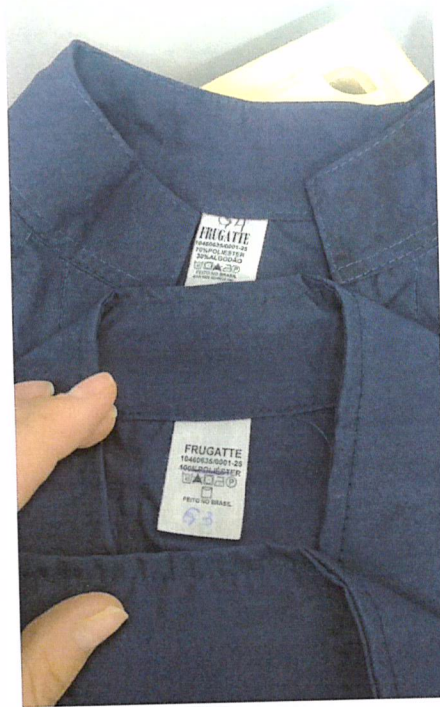
Detalhe: etiqueta de composição tecido.