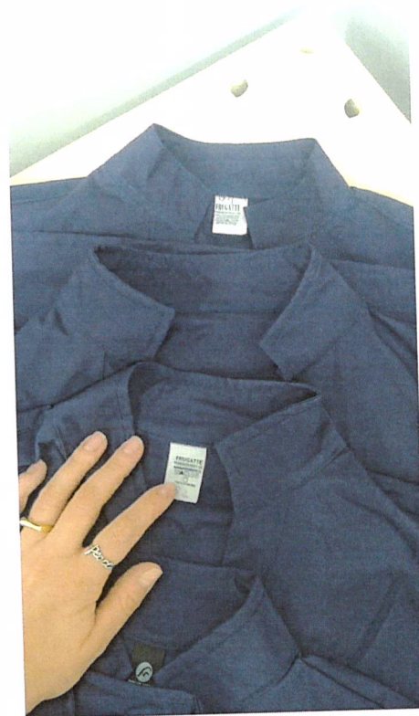
Detalhe: etiqueta de composição tecido.