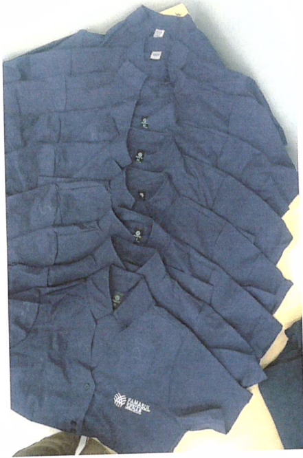
Grade camisa M/C Feminina