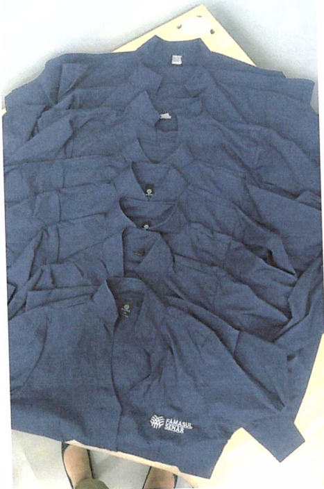
Grade camisa M/L Feminina