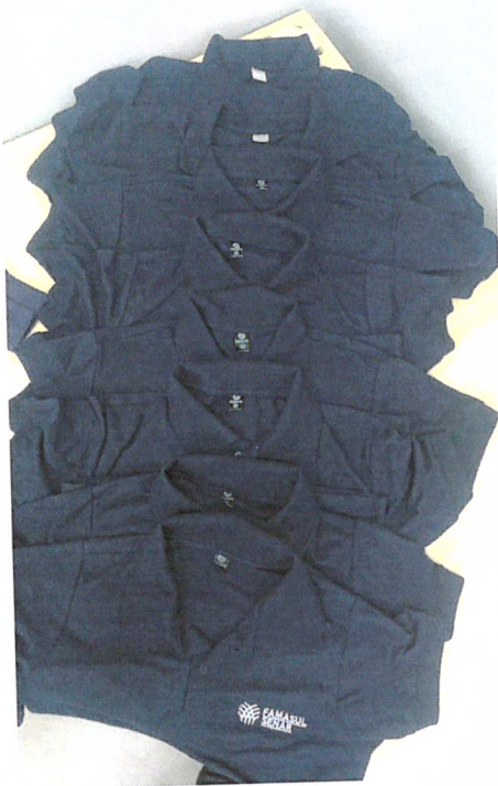
Grade Polos Femininas