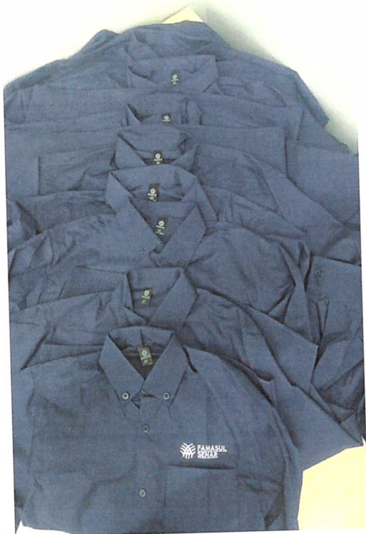
Grade camisa M/L Masculina