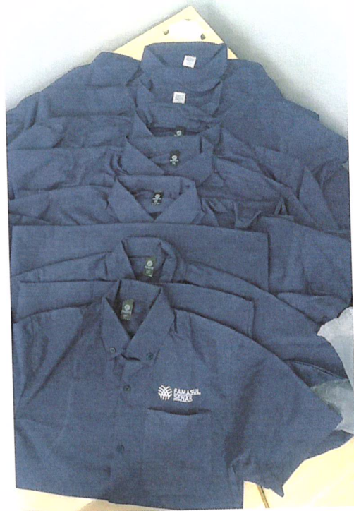
Grade camisa M/C Masculina

Lote 2: As camisetas foram enviadas sem identificação dos tipos femininas ou masculinas, sendo entregue ao todo 16 (dezesesseis) camisetas polos, etiquetadas com tamanhos que vão do PP ao GG4, porém, sem etiquetas de composição do tecido. A partir de observação, concluímos que as camisetas femininas possuem manga mais curta e as peças masculinas possuem mangas mais compridas. Foram identificadas 4 (quatro) peças que possuem etiqueta de composição de tecido, nas quais constam o tecido 100% poliéster, estando em desconformidade com a descrição do material no Termo de Referência e Carta Proposta apresentada pela empresa. Fotos abaixo: