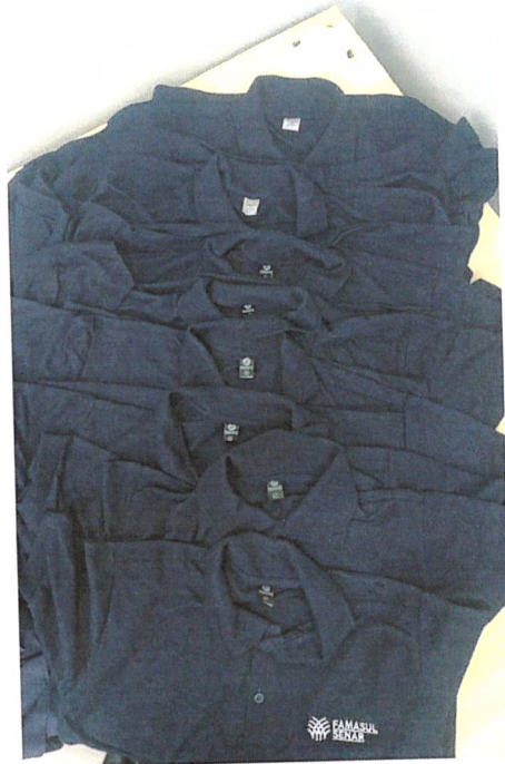
Grade Polos Masculinas

Diante do exposto, declaramos que a licitante FRUGATTE E TROIA CONFECÇÕES LTDA CNPJ 10.460.635/0001-25 não atendeu ao previsto no processo licitatório em epígrafe devendo apresentar nova grade em até 05 (cinco) dias, em respeito ao previsto no Termo de Referência.